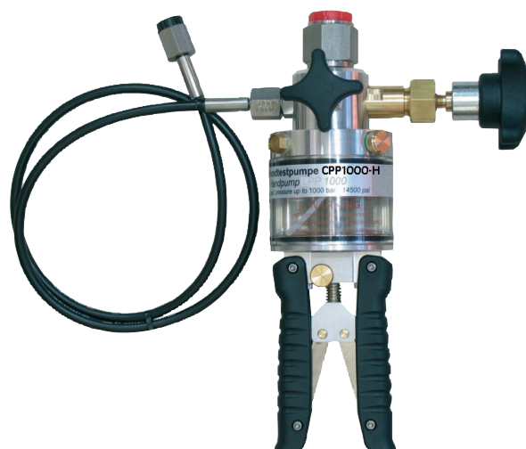
Handpump CPP 700-H och CPP 1000-H