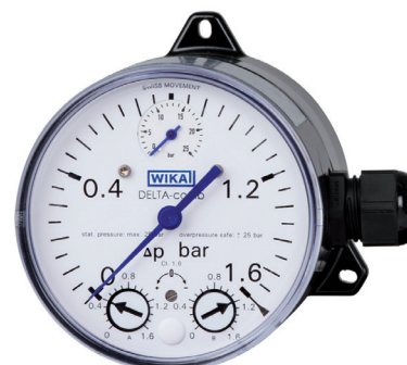
Delta Comb DPGS40 mikrobrytare SPDT med kabelutgång