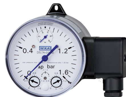
Delta Comb DPGS40 mikrobrytare SPDT med kabeldosa