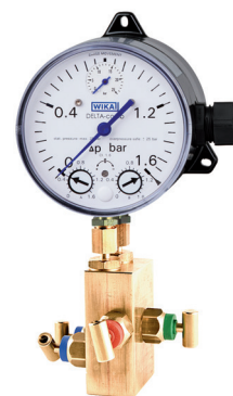
Tryckutjämningsventil 4-vägs tryckutjämningsventil finns som extra tillbehör