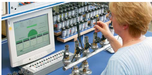
Slutkontroll av mät noggrannhet

Tryckmätare och tryckgivare med övertryck större än 200 bar har CE-märkning CE0036.