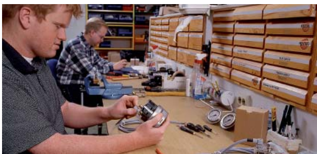
Verkstad för reparation och kundanpassning av instrument.