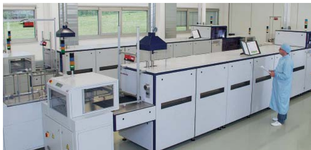
Produktionslinje för tryckgivare