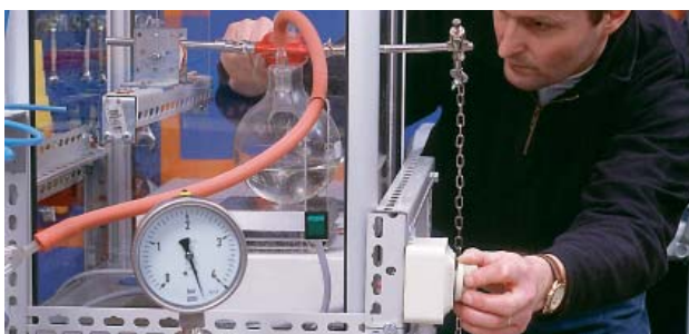
Fyllningsstation för montering av tryckförmedlare