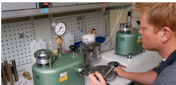
Kontroll och justering i mätrum med spårbar kalibrering